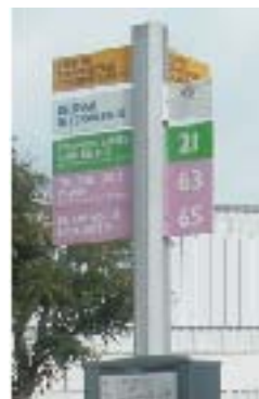
Option : Avec ailettes