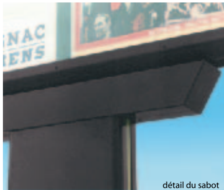
détail du sabot